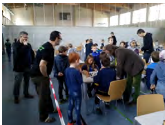
Schiedsrichter im Einsatz