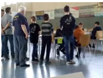
Spannung bis zur letzten Minute