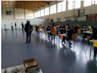
Blick in den Turniersaal 1