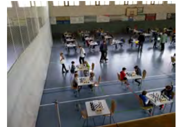
Blick in den Turniersaal 3