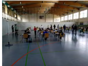
Blick in den Turniersaal 2