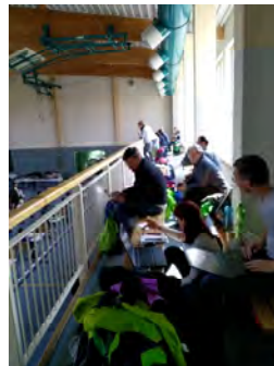
Zuschauer auf der Tribüne